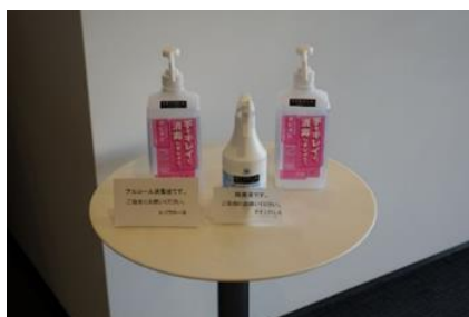
消毒液(ホール入口・トイレなど)