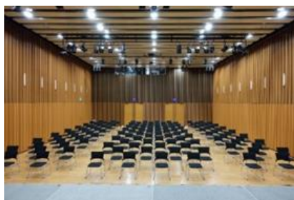
ステージ側より(レイアウト見本/126席)