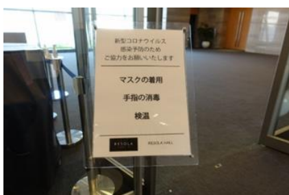
お客様へ対策お願いを掲示(ホール入口)