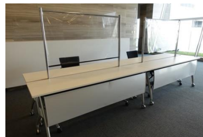
飛沫防止カーテン(受付イメージ)

レソラホールではお客様に安心・安全にご利用いただけますよう感染予防対策に努めてまいります。 ご利用についてご不明な点などございましたら、お気軽にホールへご相談ください。